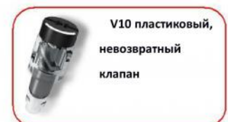
V10 пластиковый, невозвратный клапан