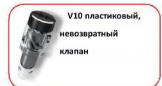
V10 пластиковый, невозвратный клапан

Разрушающая нагрузка на проушину-2000 Характеристики буя: Твердость по Shore - 66 Прочность на растяжение — 13.9 МПа Удлинение на разрыв — 587% Хладогибкость -33°C Макс. темп. использования +40°C Предельная темп. эксплуатации +50°C Плотность — 1.17г/см куб. Материал буя и проушины — ПВХ Используется технология Welcotec