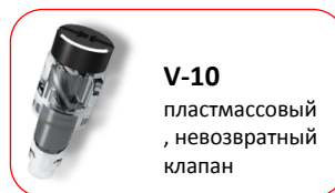
V-10 пластмассовый, невозвратный клапан